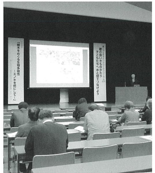
昨年のフォーラムの様子